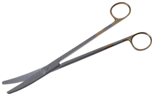
T/C エクセル・シムス剪刀 T/C Dissecting Scissors Sims Super