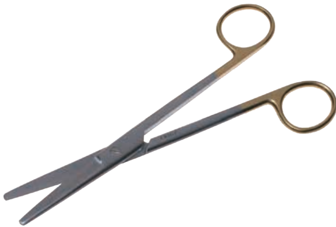
T/C メーヨ剪刀 T/C Dissecting Scissors Mayo