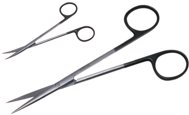
スーパー・メツェンバーム剪刀 Dissecting Scissors Metzenbaum Super

商品コード 規格サイズ B250-368V 14.5cm 直 両尖 B250-371V 14.5cm 曲 両尖