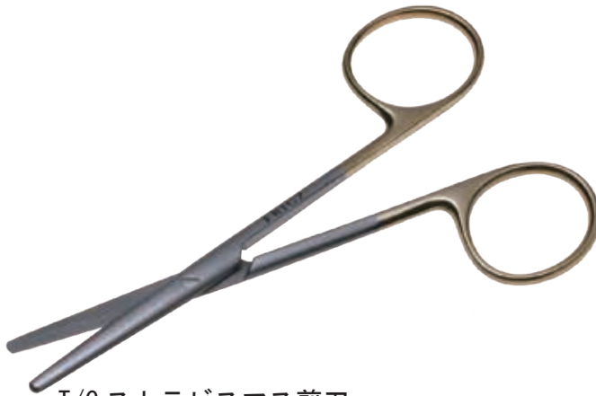
T/C ストラビスマス剪刀 T/C Dissecting Scissors Strabismus 商品コード 規格サイズ B025-010X 10cm 直