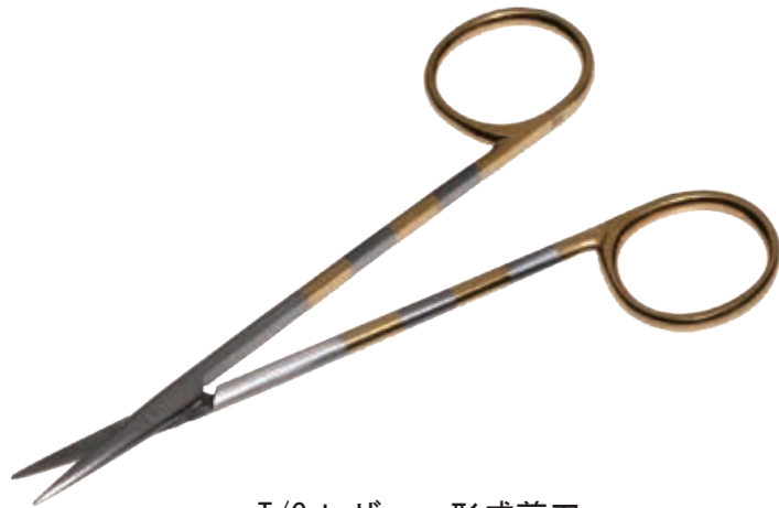
T/C レザー・形成剪刀 T/C Plastic Scissors Thin Head Razor

商品コード 規格サイズ B230-14AZ 14.5cm 直 B240-16XZ 16cm 直 B240-18XZ 18cm 直