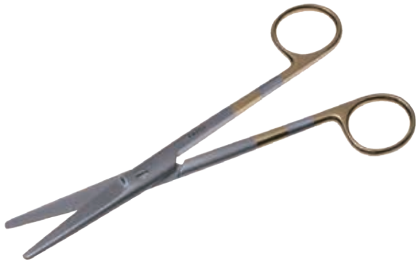
T/C エクセル・メイヨ剪刀 T/C Dissecting Scissors Mayo Super