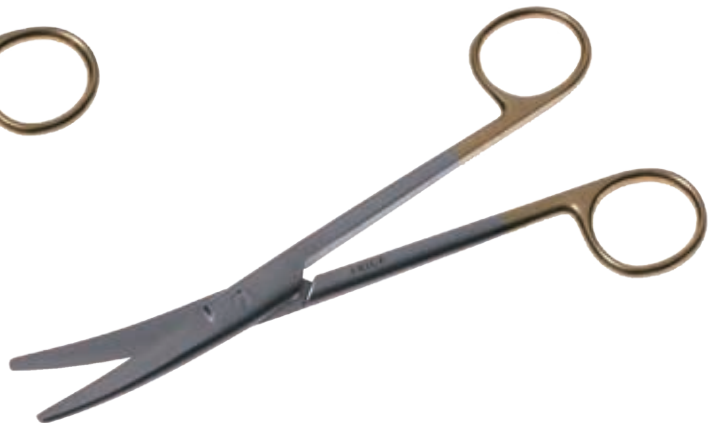
T/C メーヨ剪刀 T/C Dissecting Scissors Mayo