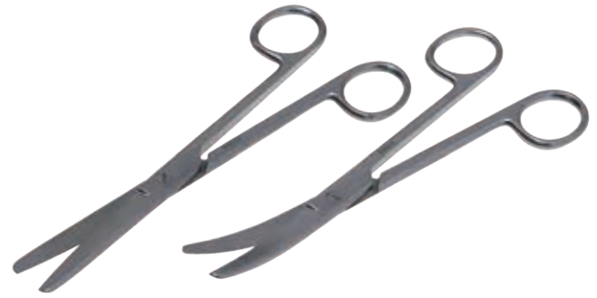
一般外科剪刀 ネジ止 Operating Scissors Standard 商品コード 規格サイズ B022-0295 18cm 直 両鈍 B022-0314 18cm 曲 両鈍 ※左利き専用有 P142