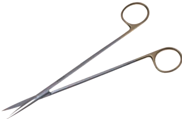
T/C メツェンバーム・フィノ 剪刀 T/C Dissecting Scissors Metzenbaum-Fino