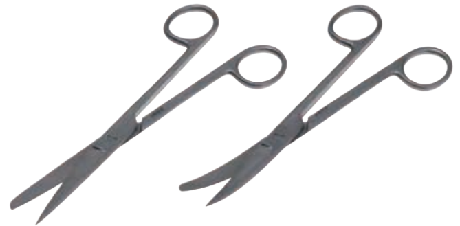
一般外科剪刀 ネジ止 Operating Scissors Standard 商品コード 規格サイズ B022-0296 18cm 直 片尖 B022-0315 18cm 曲 片尖