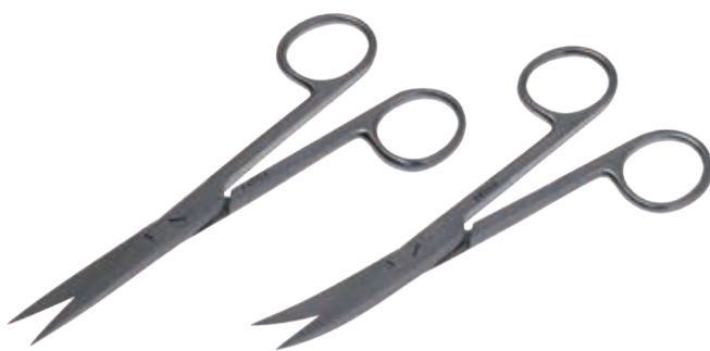
一般外科剪刀 ネジ止 Operating Scissors Standard 商品コード 規格サイズ B022-0288 14.5cm 直 両尖 B022-0307 14.5cm 曲 両尖 ※左利き専用有 P142