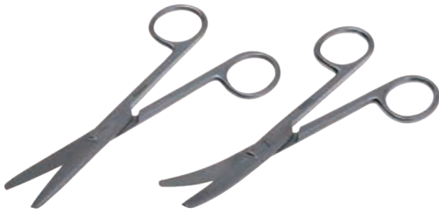
一般外科剪刀 ネジ止 Operating Scissors Standard 商品コード 規格サイズ B022-0286 14.5cm 直 両鈍 B022-0305 14.5cm 曲 両鈍 ※左利き専用有 P142