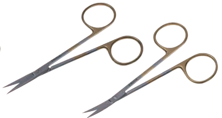
T/C エクセル・アイリス剪刀 T/C Dissecting Scissors Iris Super