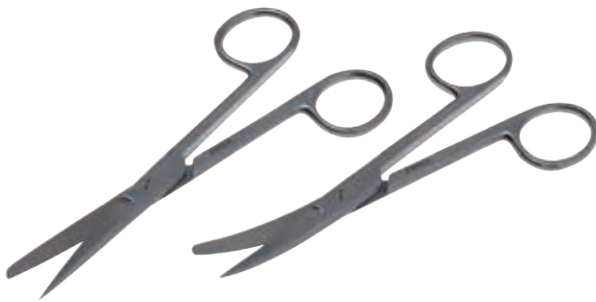
一般外科剪刀 ネジ止 Operating Scissors Standard 商品コード 規格サイズ B022-0287 14.5cm 直 片尖 ※左利き専用有 P142 B022-0306 14.5cm 曲 片尖