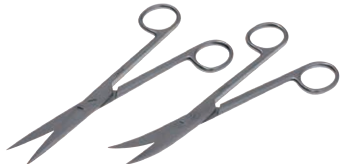
一般外科剪刀 ネジ止 Operating Scissors Standard 商品コード 規格サイズ B022-1296 18cm 直 両尖 B022-1315 18cm 曲 両尖