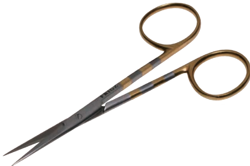
T/C レザー・ファイン剪刀 T/C Fine Scissors Razor