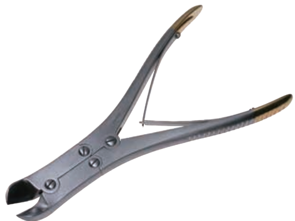
T/C 鋼線剪刀 T/C Wire Cutter 商品コード 規格サイズ B019-017X 17.5cm 1.6mm 軟鋼線用 B019-022X 22cm 2.5mm 軟鋼線用