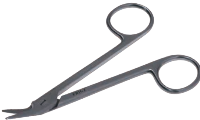
ユニバーサル剪刀 (ワイヤー剪刀) Dissecting Scissors Universal 商品コード 規格サイズ B035-0487 12cm