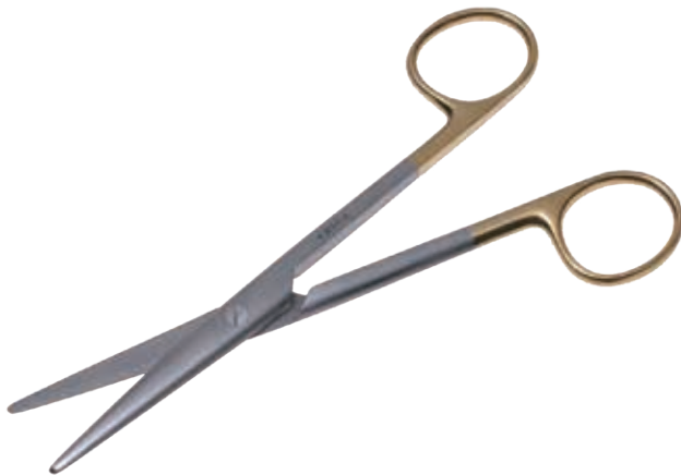
T/C メーヨ・スティーレ剪刀 T/C Dissecting Scissors Mayo-Stillé