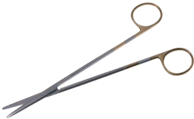
T/C エクセル・メツエンバーム剪刀 T/C Dissecting Scissors Metzenbaum Super