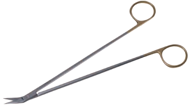
T/C ポッツミス・アングル剪刀 T/C Dissecting Scissors Potts-Smith 商品コード 規格サイズ B027-019A 19cm 25度 両尖