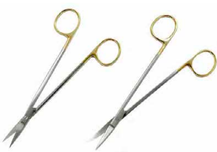
T/C ケリー剪刀 商品コード 規格サイズ B026-016X 16cm 直 B026-016C 16cm 曲