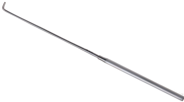
神経鉤 クライル Retractor CRILE 商品コード 規格サイズ R947-200 20cm