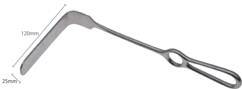
ブラウナー鉤 Retractor Brunner 商品コード 規格サイズ R111-1436 24cm 25×120 R111-1439 24cm 30×180