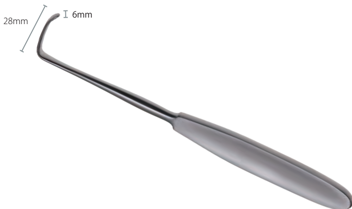
靭帯鉤 Retractor LAHEY 商品コード 規格サイズ R190-190 19cm 6 × 28