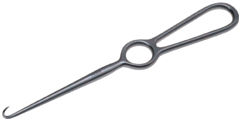
単鋭鉤 コヘル Retractor Kocher Sharp 商品コード 規格サイズ R101-1361 22cm 1爪