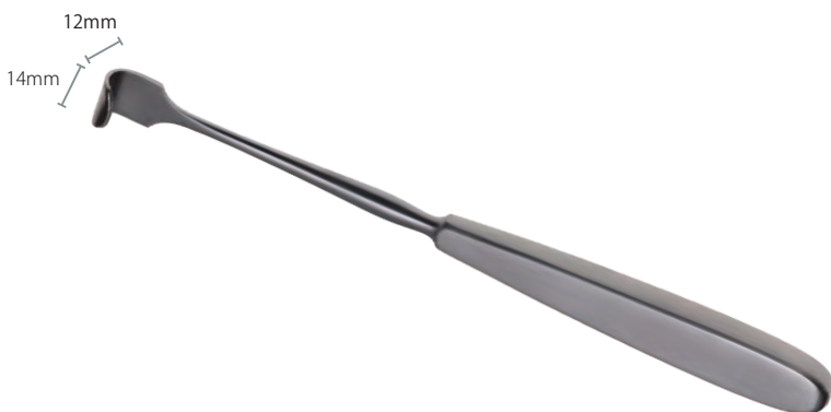
靭帯鉤 Retractor LITTLE 商品コード 規格サイズ R192-200 20cm 14 × 12