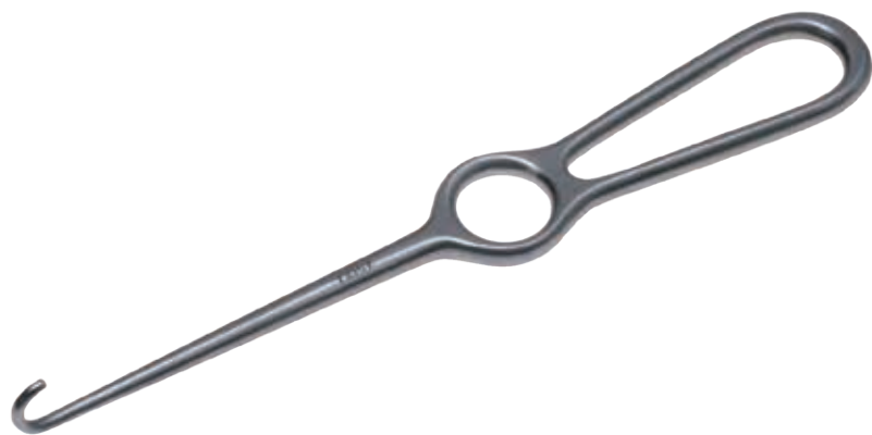
単鈍鉤 コヘル Retractor Kocher Blunt 商品コード 規格サイズ R101-1367 22cm 1爪