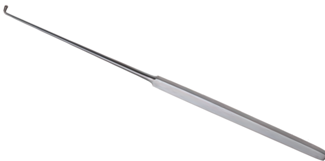
神経鉤 クッシング Retractor CUSHING 商品コード 規格サイズ R155-190 19cm R155-280 28cm