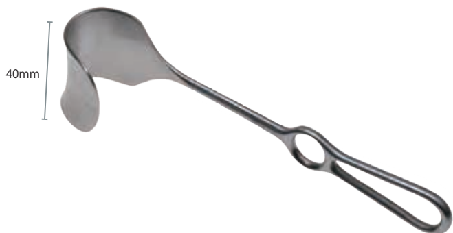
フリッチ腹壁鉤 Abdominal Retractor Fritsch 商品コード 規格サイズ R108-1422 24cm 40×45 R108-1424 24cm 60×45 R108-1425 24cm 75×45