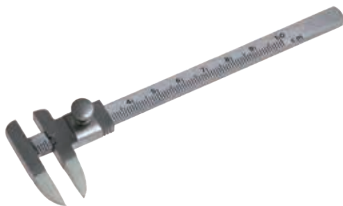
知覚計 オイレンブリヒ Measuring Instruments Japan 商品コード Z827-156B サイズ 13cm