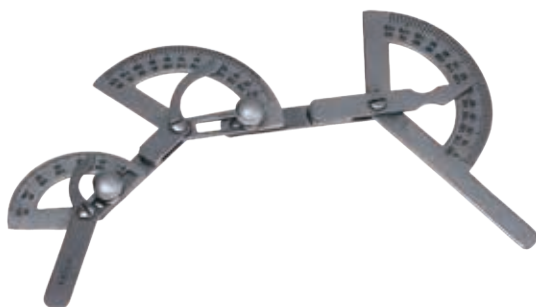
角度計 三関節 Measuring Meltken Three Joints 商品コード Z813-153C サイズ 20cm