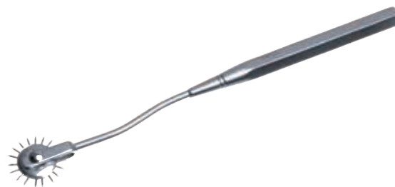
圧痛覚計 ルーレット Sensibility Wartenberg 商品コード Z827-156A サイズ 20cm