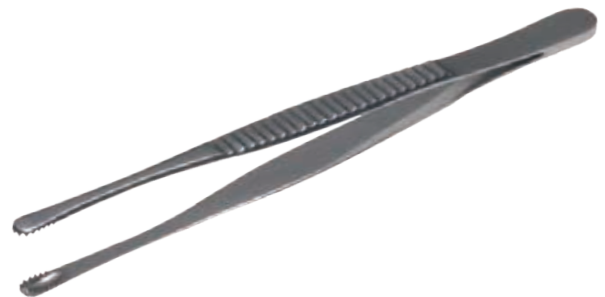
ルースピンセット