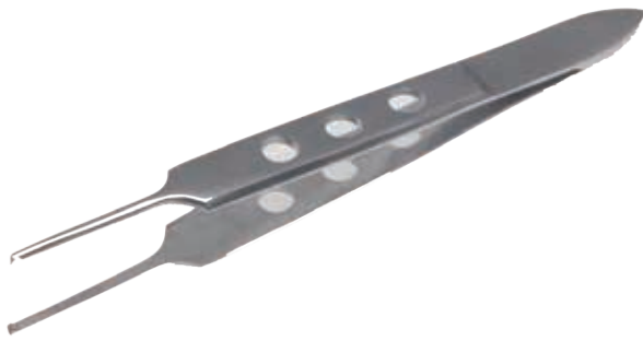
ビショップ有鉤ピンセット