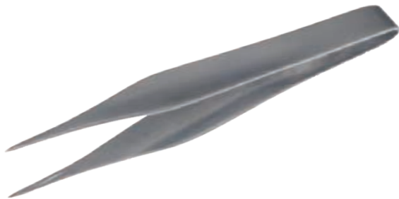
スプリンターピンセット