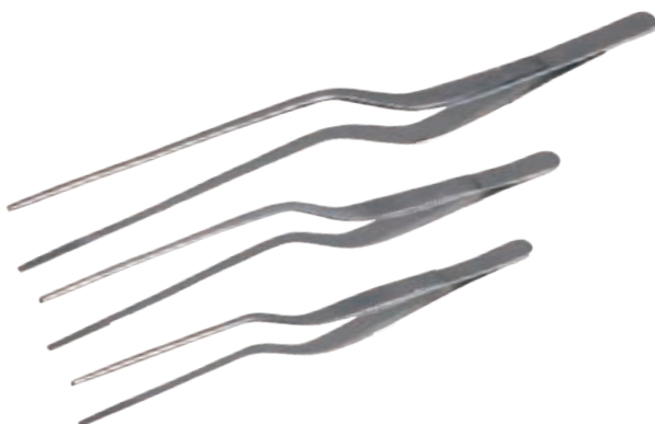
アングルピンセット

商品コード 規格サイズ BS-1057 14cm BS-1058 16cm BS-1059 20cm