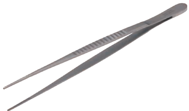
ドベイキーピンセット

商品コード 規格サイズ BS-1057 14cm BS-1058 16cm BS-1059 20cm