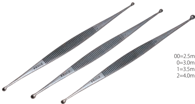
歯科用両頭鋭匙 Bone Currettes Williger 商品コード 規格サイズ T008-5094 13.5cm 00*0 T008-5095 13.5cm 0*1 T008-5096 13.5cm 1*2