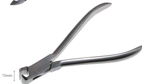
改良骨鉗子 Nail Cutter Dumont 商品コード 規格サイズ T111-6958 フラットヘッド巾 15mm