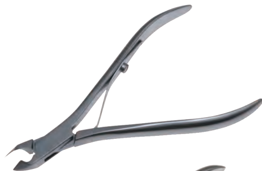
骨鉗子 Nail Cutter Goldman Fox 商品コード 規格サイズ T078-6780A 10cm