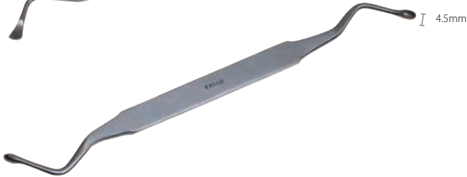
歯科用両頭鋭匙 Bone Currettes Seldin 商品コード 規格サイズ T008-6007 19cm