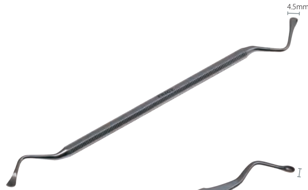
歯科用両頭鋭匙 Bone Currettes Lucas 商品コード 規格サイズ T009-6014 4R/L