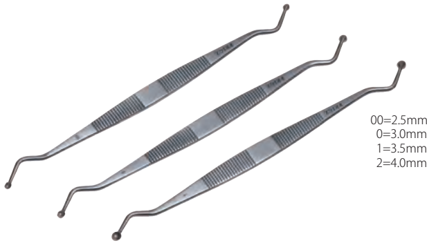
歯科用両頭鋭匙 Bone Currettes Williger 商品コード 規格サイズ T008-5097 15.5cm 00*00 T008-5098 15.5cm 0*0 T008-5099 15.5cm 1*1 T008-5100 15.5cm 2*2