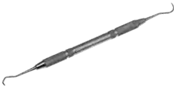
両頭スケーラー Scalers 商品コード 規格サイズ T042-6414 16.5cm