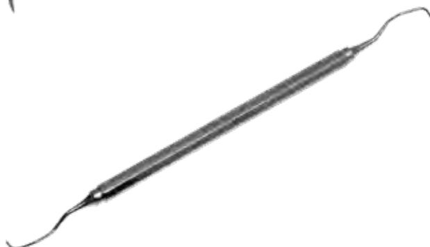
両頭スケーラー Scalers Gracey Curettes 商品コード 規格サイズ T045-6453 グレイシー 11/12 17cm