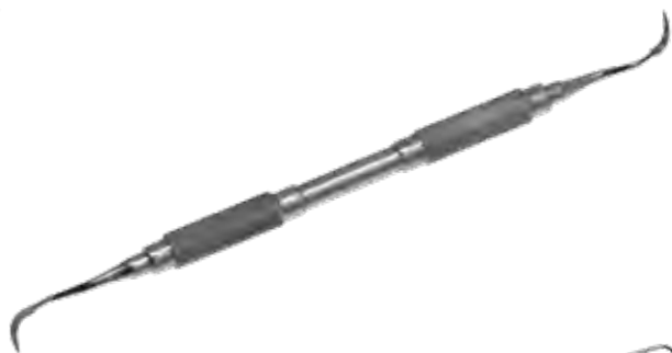
両頭スケーラー Scalers Crane-Caplan 商品コード 規格サイズ T050-6511 #G5-6 17cm