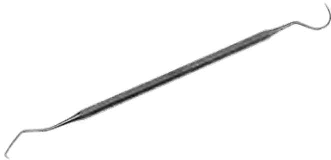
両頭エキスプローラー Explorer Double Ended 商品コード 規格サイズ T049-6505 18cm #5