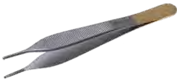
T/C アドソンマイクロ ピンセット T/C Tissue Forceps Adson Micro Teeth