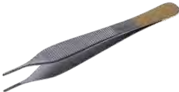
T/C アドソンマイクロ ピンセット T/C Tissue Forceps Adson Micro