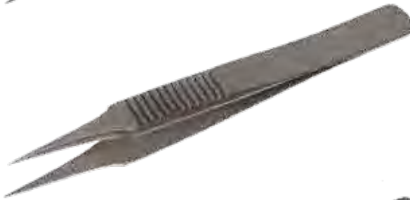
精密ピンセット Tissue Forceps Delicate