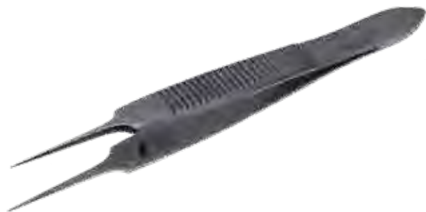
ボナコルト デリケートピンセット Tissue Forceps Delicate Bonaccolto