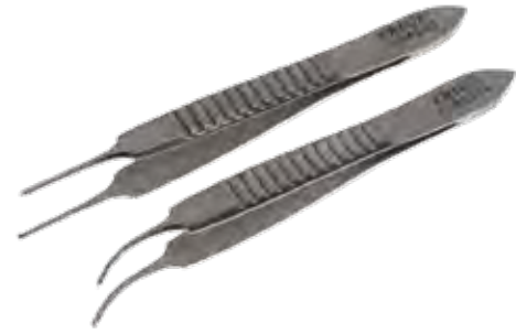
グレフェ デリケートピンセット Tissue Forceps Delicate Iris-Graefe Teeth

商品コード サイズ A359-4202 7cm 有鉤 A359-4204 7cm 有鉤 曲