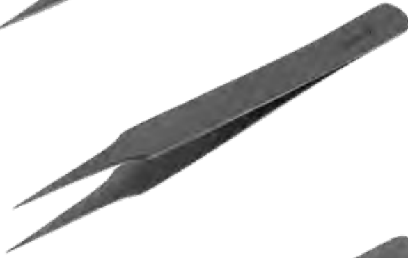
精密ピンセット Tissue Forceps Delicate