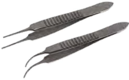
グレフェ デリケートピンセット Tissue Forceps Delicate Iris-Graefe