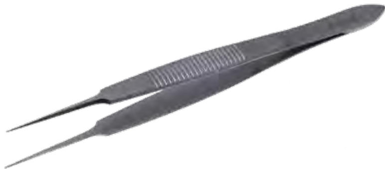
ボナコルト デリケートピンセット Tissue Forceps Delicate Bonaccolto