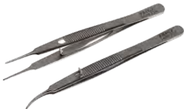
スチーブン デリケートピンセット Tissue Forceps Delicate Stevens Teeth

商品コード サイズ A362-4243 8.5cm 有鉤 A362-4243L 11.5cm 有鉤