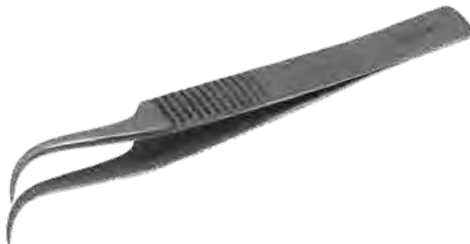
精密ピンセット Tissue Forceps Delicate Curved