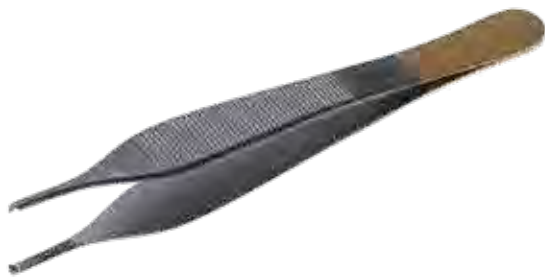
T/C アドソン ピンセット T/C Tissue Forceps Adson Teeth