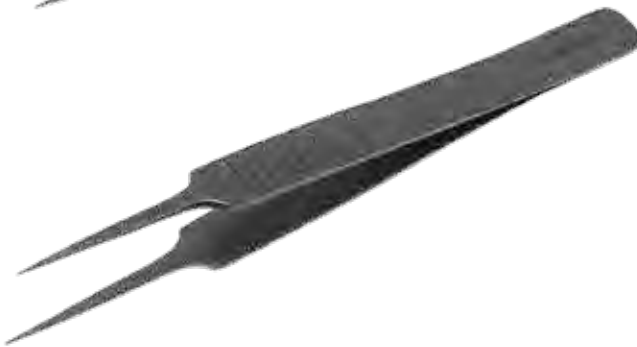
精密ピンセット Tissue Forceps Delicate