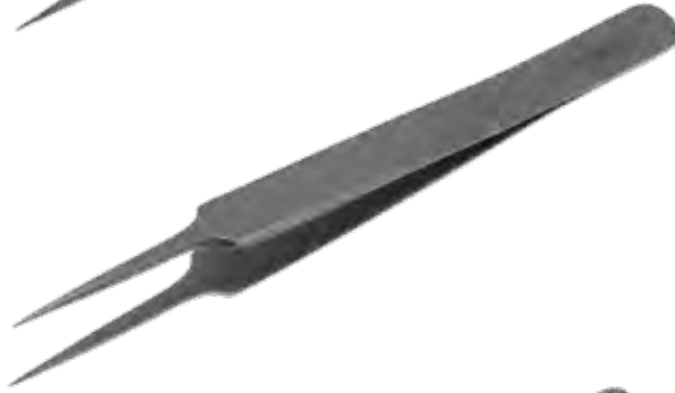
精密ピンセット Tissue Forceps Delicate