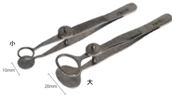
デスマル ピンセット Entropium Forceps

商品コード サイズ A360-4213 10cm 有鉤 A360-4215 10cm 有鉤 曲