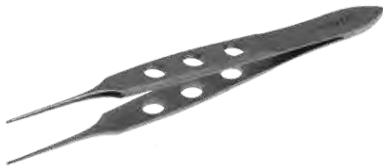
ビショップ デリケートピンセット Tissue Forceps Delicate Bishop Teeth

商品コード サイズ A362-4242 8.5cm 無鉤 A362-4242L 11.5cm 無鉤