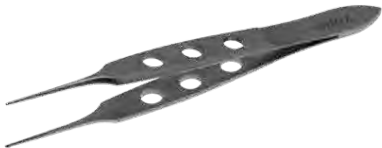
ビショップ デリケートピンセット Tissue Forceps Delicate Bishop

商品コード サイズ A362-4242 8.5cm 無鉤 A362-4242L 11.5cm 無鉤