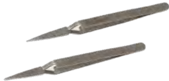
マイクロリングピンセット

商品コード サイズ A368-4297 小 9cm A368-4302 大 9cm