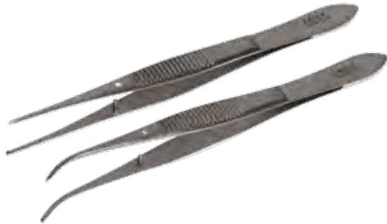
グレフェ デリケートピンセット Tissue Forceps Delicate Iris-Graefe Teeth

商品コード サイズ A359-4202 7cm 有鉤 A359-4204 7cm 有鉤 曲