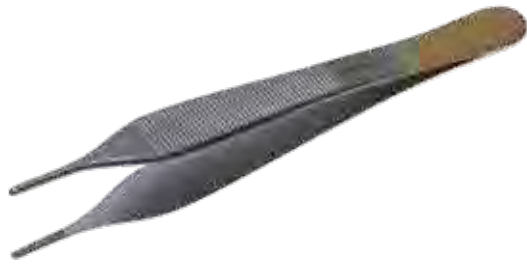
T/C アドソン ピンセット T/C Tissue Forceps Adson