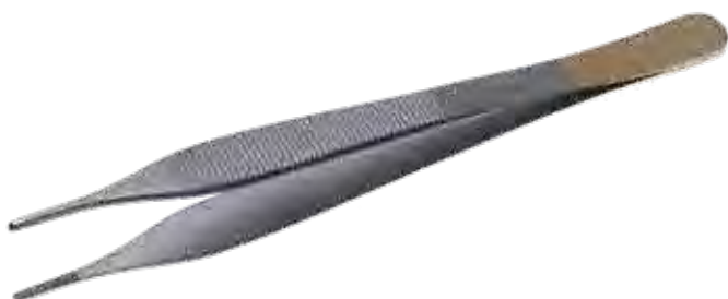
T/C アドソンロング ピンセット T/C Tissue Forceps Long Adson

商品コード サイズ A001-012C 12cm 0.3mmTip 3*4 有鉤