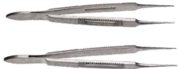
形成スーパーデリケートピンセット

商品コード 規格サイズ EF-2101 11.5cm 無鉤 EF-2102 11.5cm 有鉤