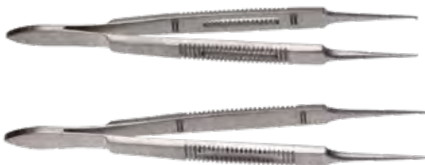
形成デリケートピンセット

商品コード 規格サイズ AM525-100L 12.5cm 大 AM525-100M 12.5cm 小