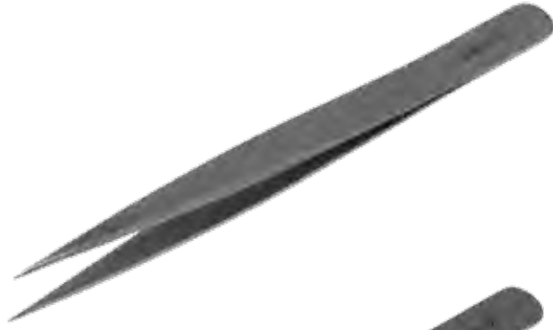
精密ピンセット Tissue Forceps Delicate