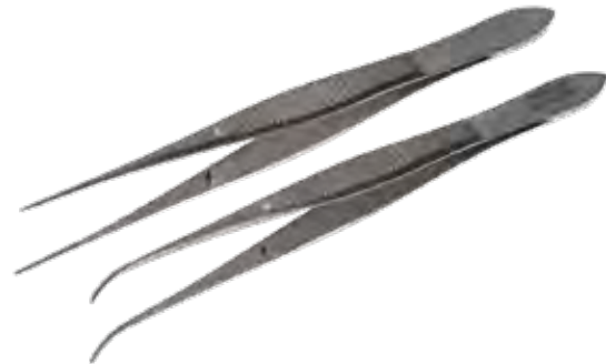
グレフェ デリケートピンセット Tissue Forceps Delicate Iris-Graefe Teeth

商品コード サイズ A360-4207 10cm A360-4209 10cm 曲