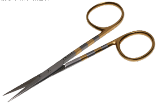
T/C レザー・形成剪刀 T/C Plastic Scissors Thin Head Razor

商品コード 規格サイズ B230-14AZ 14.5cm 直 B240-16XZ 16cm 直 B240-18XZ 18cm 直