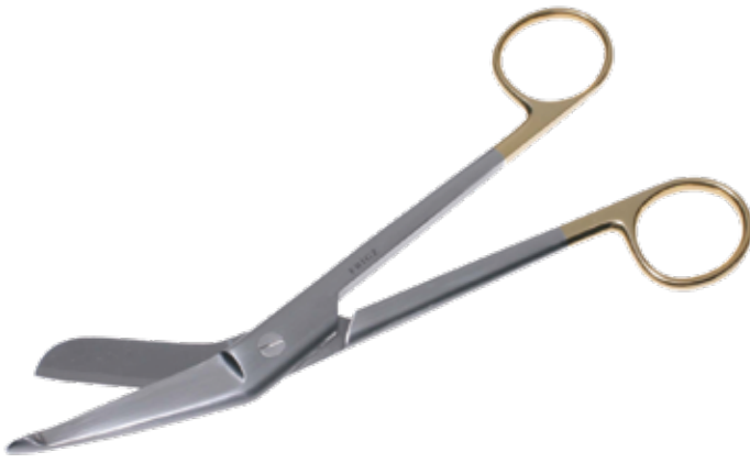
T/C リスター剪刀 (包帯剪刀) T/C Dissecting Scissors Lister-Bandage 商品コード 規格サイズ B028-018X 18cm