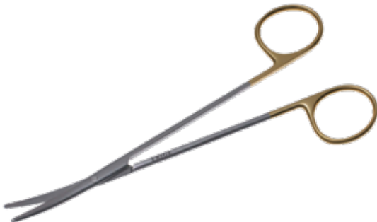
T/C トエニスアドソン剪刀 T/C Dissecting Scissors Toennis-Adson