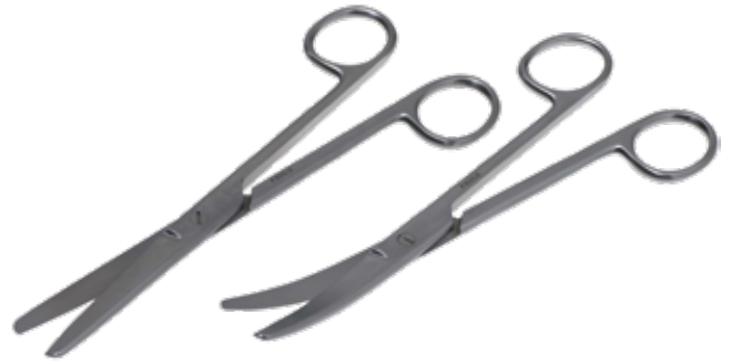
一般外科剪刀 ネジ止 Operating Scissors Standard 商品コード 規格サイズ B022-0295 18cm 直 両鈍 B022-0314 18cm 曲 両鈍 ※左利き専用有 P141