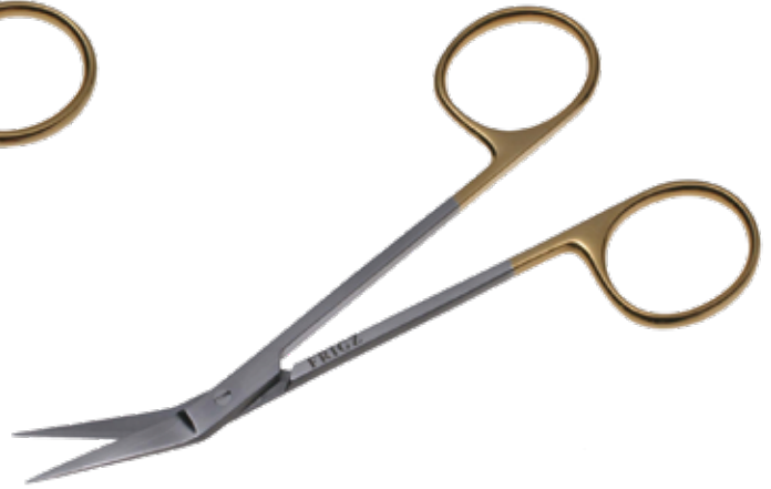
T/C ワグナー剪刀 T/C Dissecting Scissors Wagner

商品コード 規格サイズ B025-010A 12cm 直 B025-010B 12cm 曲