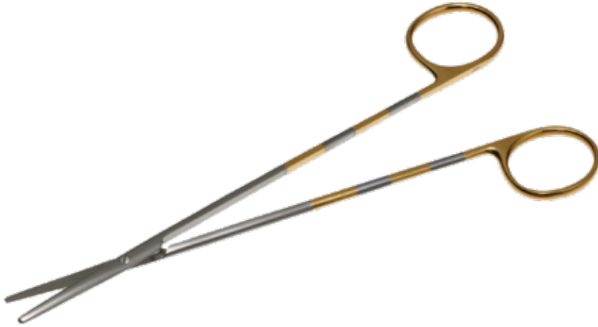
T/C レザー・メツェンバウム・フィノ剪刀 T/C Dissecting Scissors Metzenbaum Fino Razor

商品コード 規格サイズ B230-14AZ 14.5cm 直 B240-16XZ 16cm 直 B240-18XZ 18cm 直