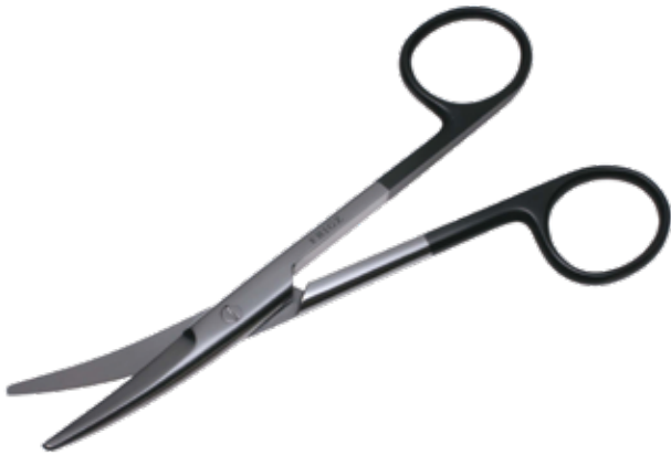
スーパー・メーヨ剪刀 Dissecting Scissors Mayo Super

商品コード 規格サイズ B230-330V 14.5cm 直 B230-336V 17cm 直