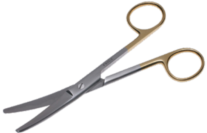
T/C 外科剪刀 T/C Operating Scissors Standard 商品コード サイズ B021-014C 14.5cm 曲 両鈍