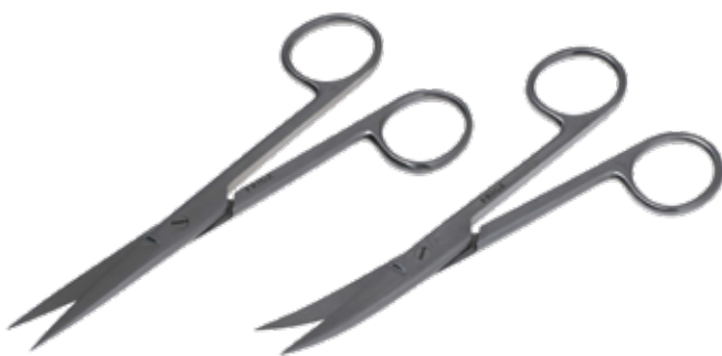
一般外科剪刀 ネジ止 Operating Scissors Standard 商品コード 規格サイズ B022-0288 14.5cm 直 両尖 B022-0307 14.5cm 曲 両尖 ※左利き専用有 P141