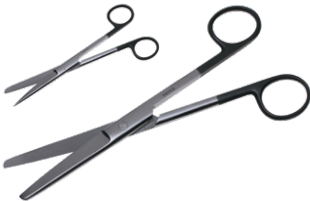
スーパー・外科剪刀 Operating Scissors Standard Super 商品コード 規格サイズ B220-295V 18cm 直 両鈍 B220-296V 18cm 直 片尖