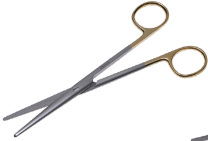
T/C メーヨ・レクサー剪刀 T/C Dissecting Scissors Mayo-Lexer 商品コード サイズ B022-016X 16cm 直