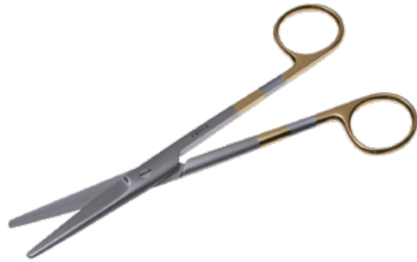
T/C エクセル・メーヨ剪刀 T/C Dissecting Scissors Mayo Super