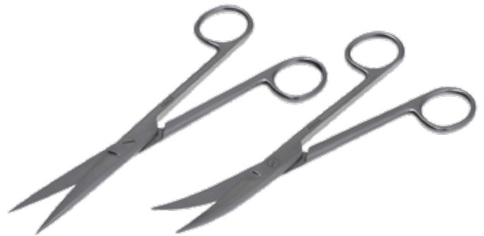
一般外科剪刀 ネジ止 Operating Scissors Standard 商品コード 規格サイズ B022-1296 18cm 直 両尖 B022-1315 18cm 曲 両尖