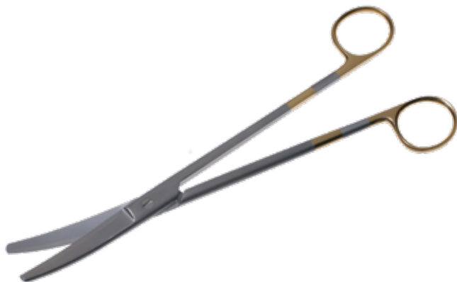
T/C エクセル・シムス剪刀 T/C Dissecting Scissors Sims Super