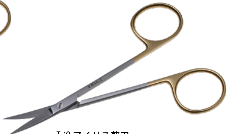
T/C アイリス剪刀 T/C Dissecting Scissors Iris 商品コード 規格サイズ B025-011C 11.5cm 曲