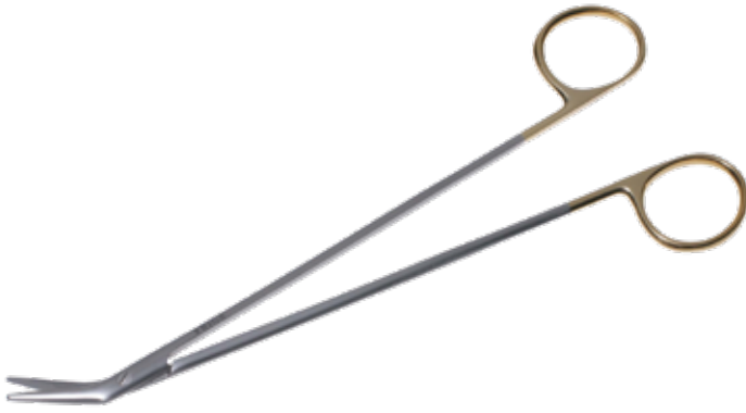
T/C ドベイキー・アングル剪刀 T/C Dissecting Scissors DeBakey 商品コード 規格サイズ B027-019D 19cm 25度 両鈍