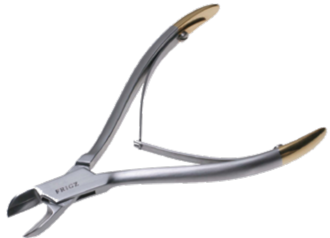
T/C 鋼線剪刀 T/C Wire Cutter 商品コード 規格サイズ B019-012X 12.5cm ※切断可能ワイヤ (軟鋼線) 径 1mm まで