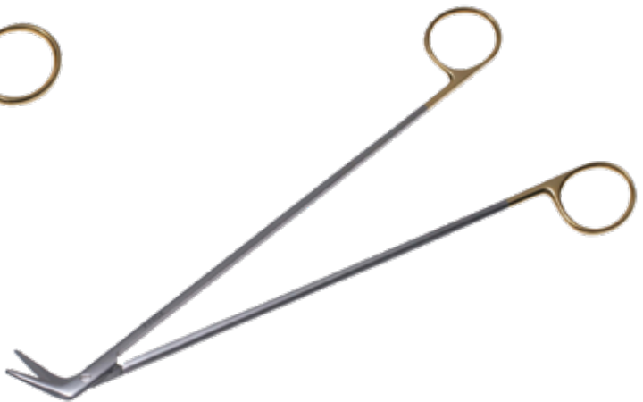
T/C ドベイキー・アングル剪刀 T/C Dissecting Scissors DeBakey 商品コード 規格サイズ B027-023C 23cm 45度 両鈍