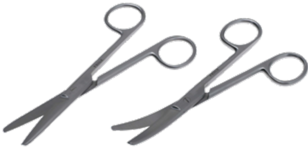
一般外科剪刀 ネジ止 Operating Scissors Standard 商品コード 規格サイズ B022-0286 14.5cm 直 両鈍 B022-0305 14.5cm 曲 両鈍 ※左利き専用有 P141