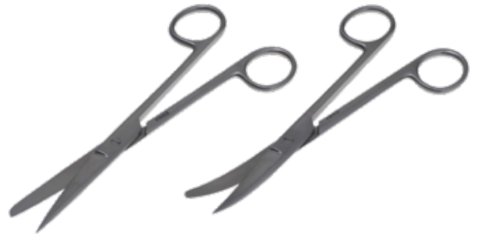
一般外科剪刀 ネジ止 Operating Scissors Standard 商品コード 規格サイズ B022-0296 18cm 直 片尖 B022-0315 18cm 曲 片尖