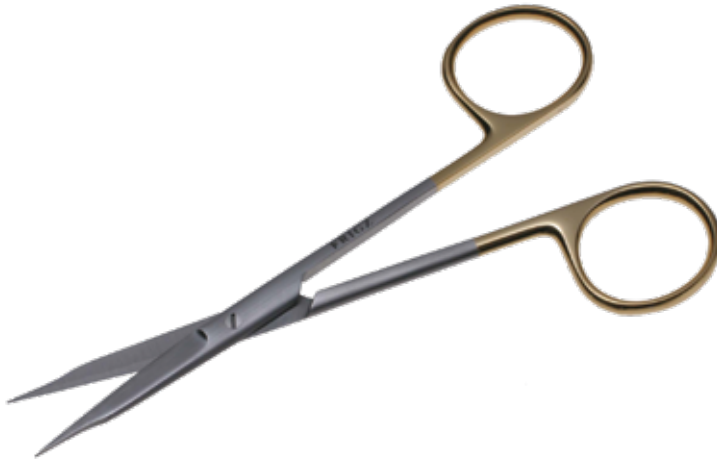
T/C フォクス剪刀 T/C Dissecting Scissors Goldman-Fox