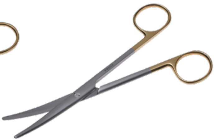
T/C メーヨ・レクサー剪刀 T/C Dissecting Scissors Mayo-Lexer 商品コード サイズ B022-016C 16cm 曲