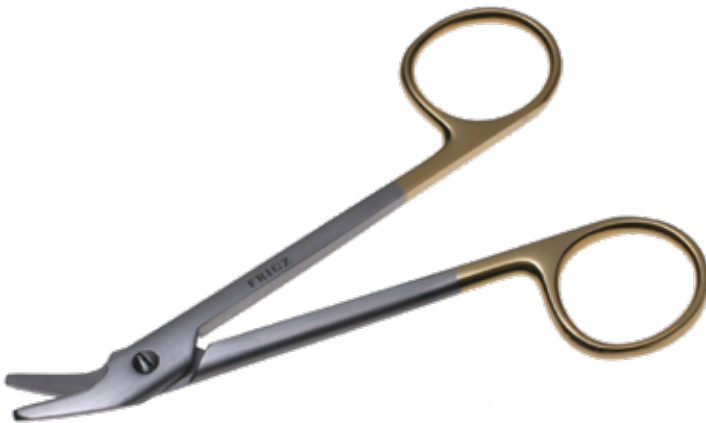
T/C ユニバーサル剪刀 (ワイヤー剪刀) T/C Dissecting Scissors Universal 商品コード 規格サイズ B025-012X 12cm ※切断可能ワイヤ (軟鋼線) 径 1mm まで