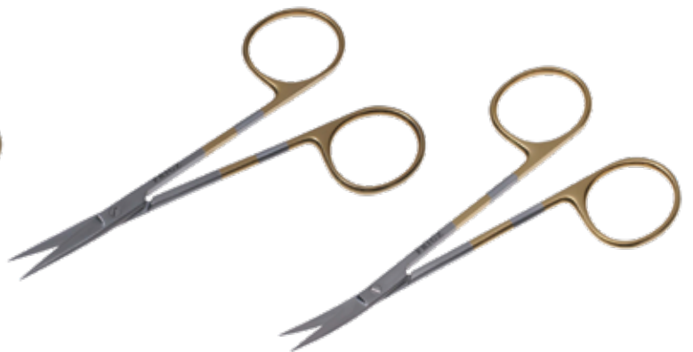
T/C エクセル・アイリス剪刀 T/C Dissecting Scissors Iris Super