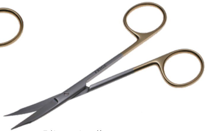
T/C フォクス剪刀 T/C Dissecting Scissors Goldman-Fox