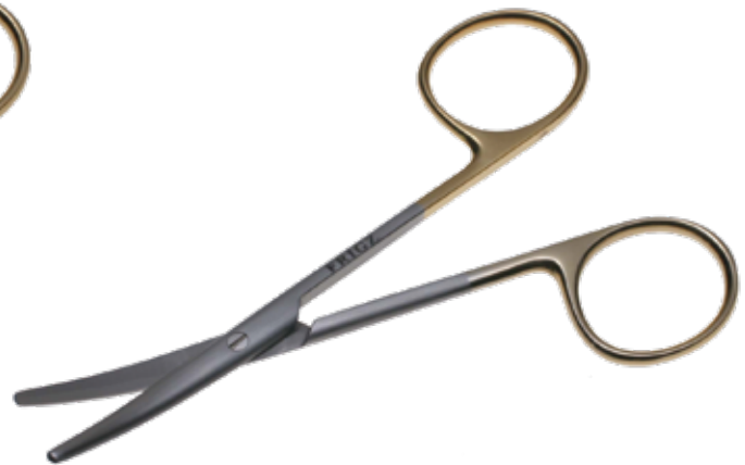
T/C ストラビスマス剪刀 T/C Dissecting Scissors Strabismus 商品コード 規格サイズ B025-010C 10cm 曲