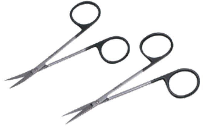
スーパー・アイリス剪刀 Dissecting Scissors Iris Super

商品コード 規格サイズ B230-331V 14.5cm 曲 B230-337V 17cm 曲