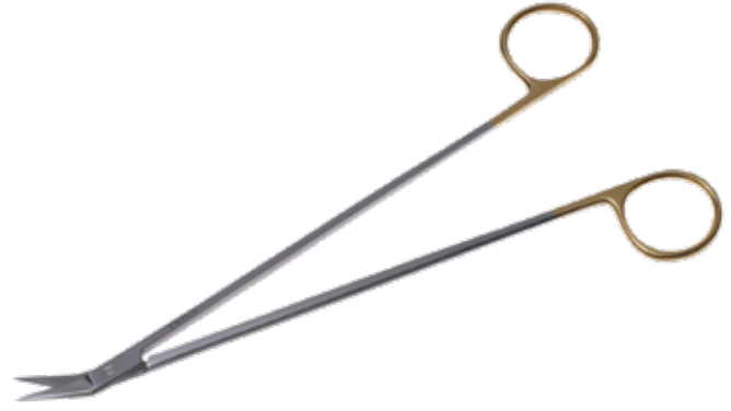
T/C ポッツミス・アングル剪刀 T/C Dissecting Scissors Potts-Smith