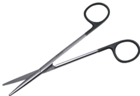
スーパー・メツェンバウム剪刀 Dissecting Scissors Metzenbaum Super 商品コード 規格サイズ B250-366V 14.5cm 直 B251-366V 16cm 直 B260-373V 18cm 直 B260-379V 20cm 直