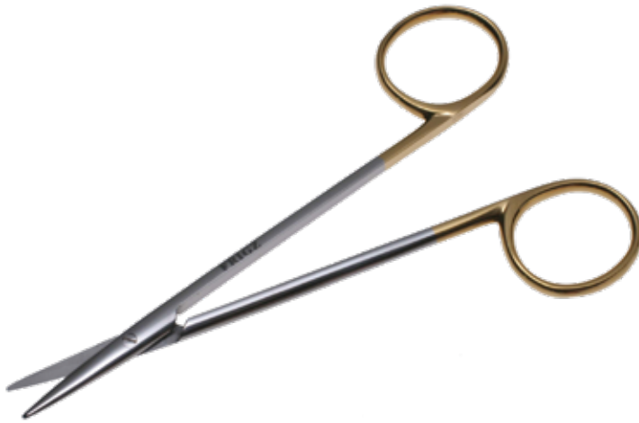
T/C 形成デリケート剪刀 T/C Plastic Scissors Thin Head

商品コード 規格サイズ B025-010A 12cm 直 B025-010B 12cm 曲