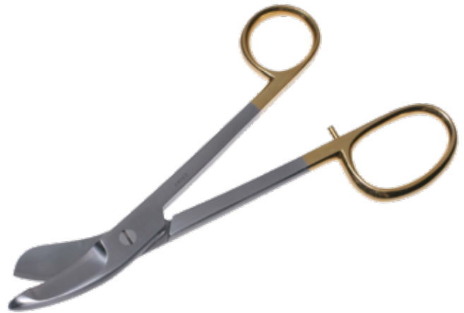
T/C ブランス剪刀 (ギブス剪刀) T/C Dissecting Scissors Bruns 商品コード 規格サイズ B028-024X 24cm