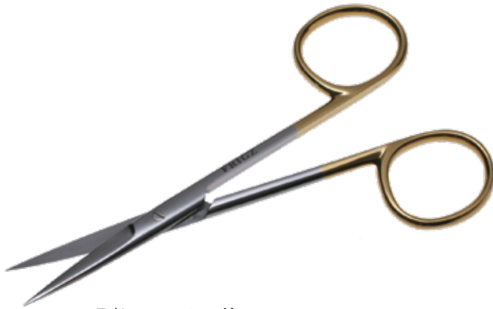
T/C ファイン剪刀 T/C Dissecting Scissors Fine 商品コード 規格サイズ B025-011A 10.5cm 直