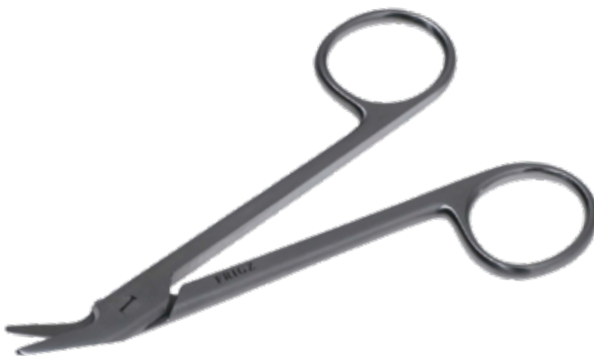
ユニバーサル剪刀 (ワイヤー剪刀) Dissecting Scissors Universal 商品コード 規格サイズ B035-0487 12cm