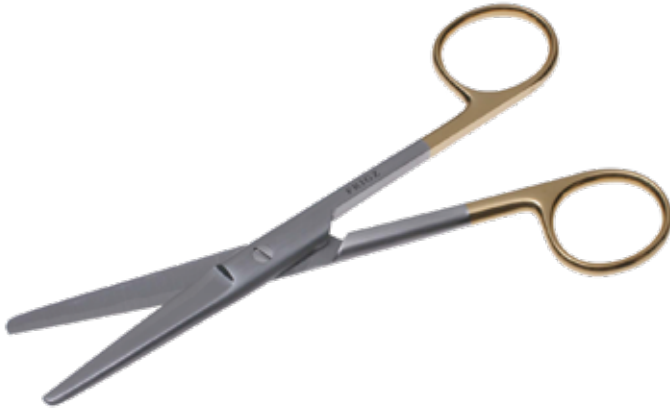
T/C 外科剪刀 T/C Operating Scissors Standard 商品コード サイズ B021-014X 14.5cm 直 両鈍