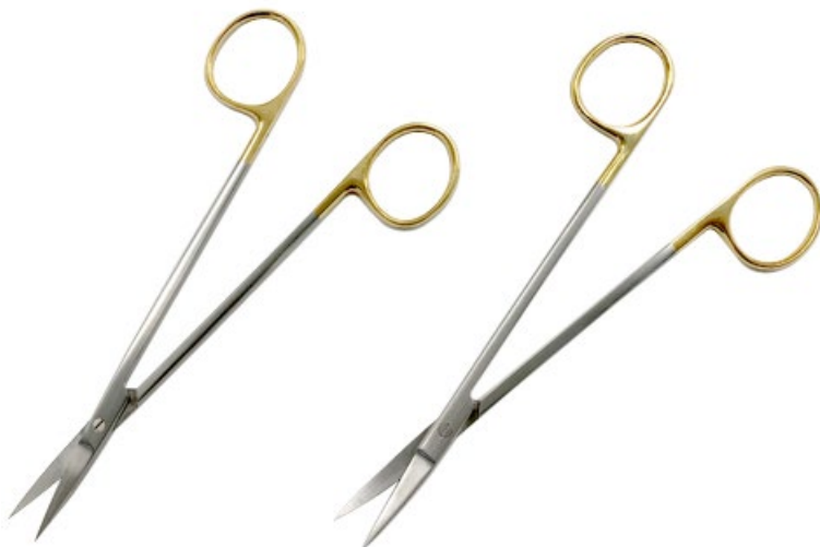
T/C ケリー剪刀 商品コード 規格サイズ B026-016X 16cm 直 B026-016C 16cm 曲