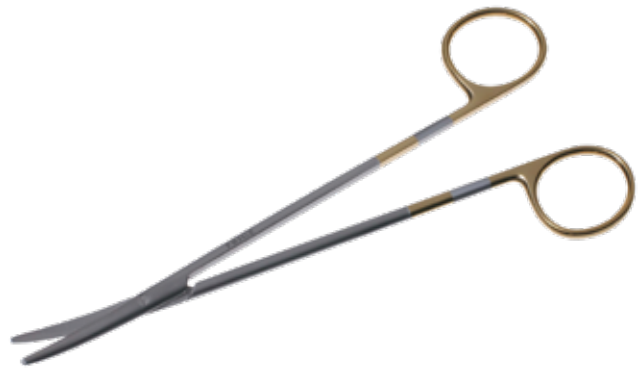
T/C エクセル・メツエンバーム剪刀 T/C Dissecting Scissors Metzenbaum Super