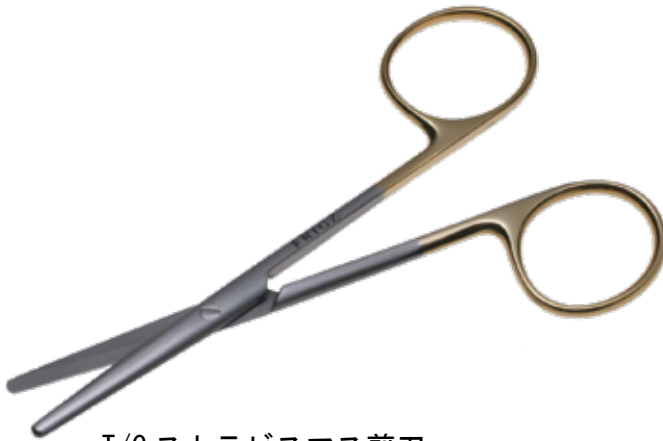
T/C ストラビスマス剪刀 T/C Dissecting Scissors Strabismus 商品コード 規格サイズ B025-010X 10cm 直