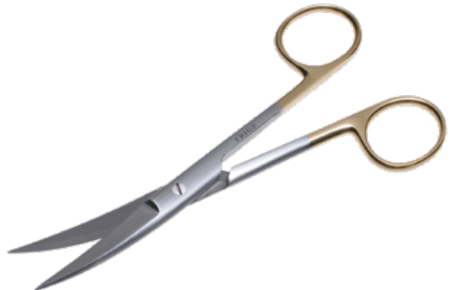
T/C 外科剪刀 T/C Operating Scissors Standard 商品コード サイズ B021-014M 14.5cm 曲 両尖