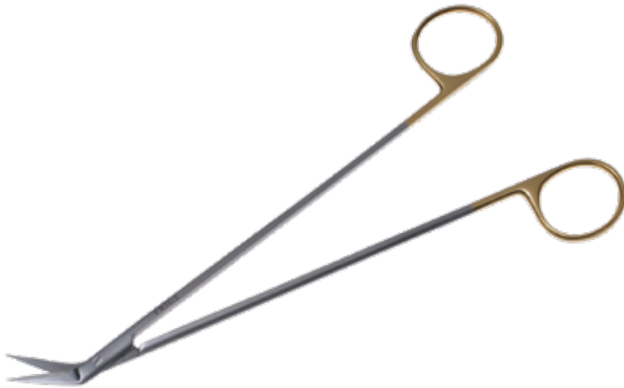
T/C ポッツミス・アングル剪刀 T/C Dissecting Scissors Potts-Smith