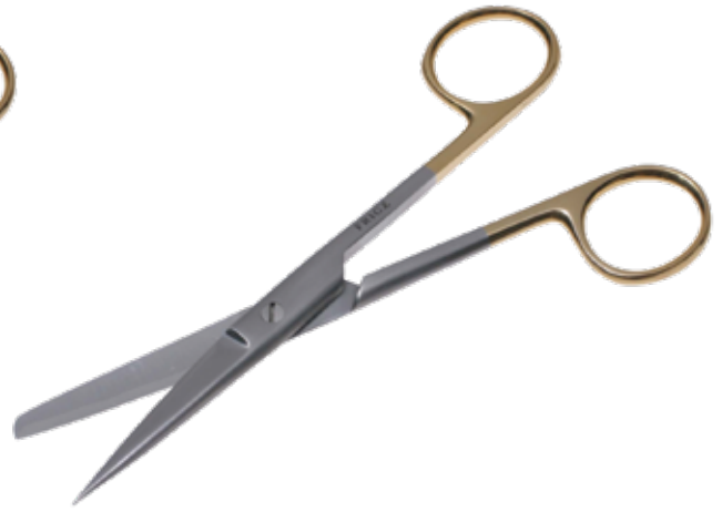
T/C 外科剪刀 T/C Operating Scissors Standard 商品コード サイズ B021-014A 14.5cm 直 片尖