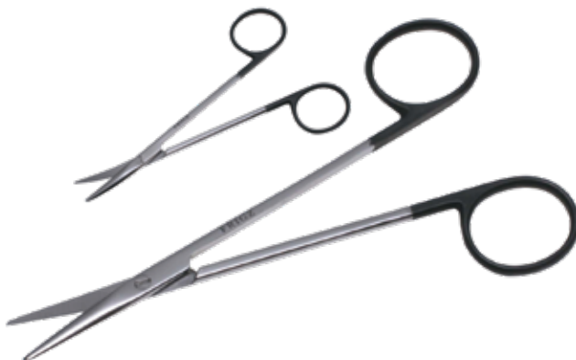
スーパー・形成剪刀 Plastic Scissors Super

商品コード 規格サイズ B340-476V 11.5cm 直 B340-477V 11.5cm 曲