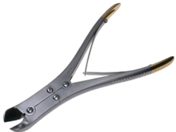
T/C 鋼線剪刀 T/C Wire Cutter 商品コード 規格サイズ B019-017X 17.5cm 1.6mm 軟鋼線用 B019-022X 22cm 2.5mm 軟鋼線用