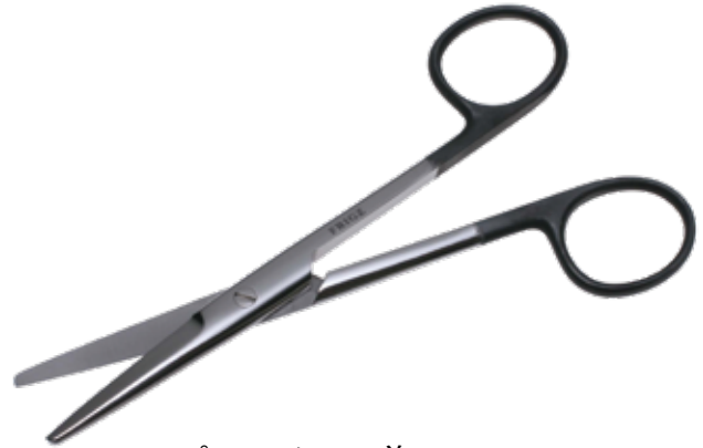
スーパー・メーヨ剪刀 Dissecting Scissors Mayo Super

商品コード 規格サイズ B250-368V 14.5cm 直 両尖 B250-371V 14.5cm 曲 両尖