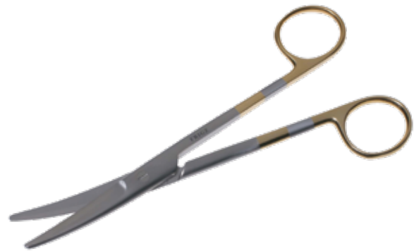
T/C エクセル・メーヨ剪刀 T/C Dissecting Scissors Mayo Super