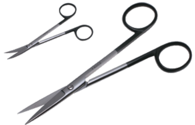
スーパー・形成特殊剪刀 Plastic Scissors Reconstructive Super

商品コード 規格サイズ B992-024V 13cm 直 B992-027V 13cm 曲