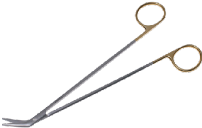
T/C ドベイキー・アングル剪刀 T/C Dissecting Scissors DeBakey 商品コード 規格サイズ B027-019C 19cm 45度 両鈍