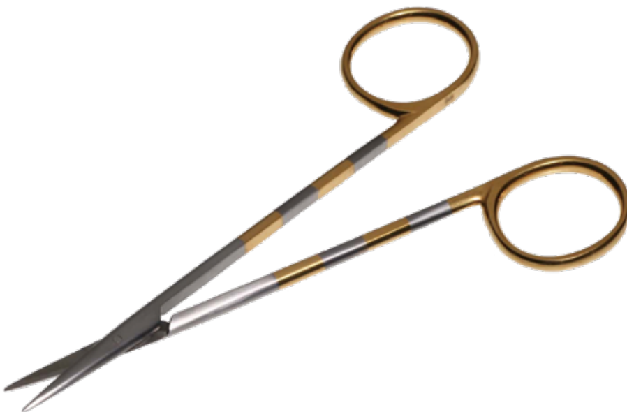
T/C レザー・ファイン剪刀 T/C Fine Scissors Razor