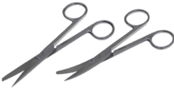
一般外科剪刀 ネジ止 Operating Scissors Standard 商品コード 規格サイズ B022-0287 14.5cm 直 片尖 B022-0306 14.5cm 曲 片尖